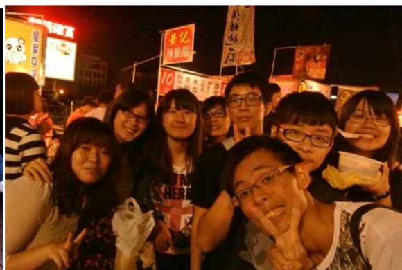
*餓鈴鼓飽EX~夜食人生