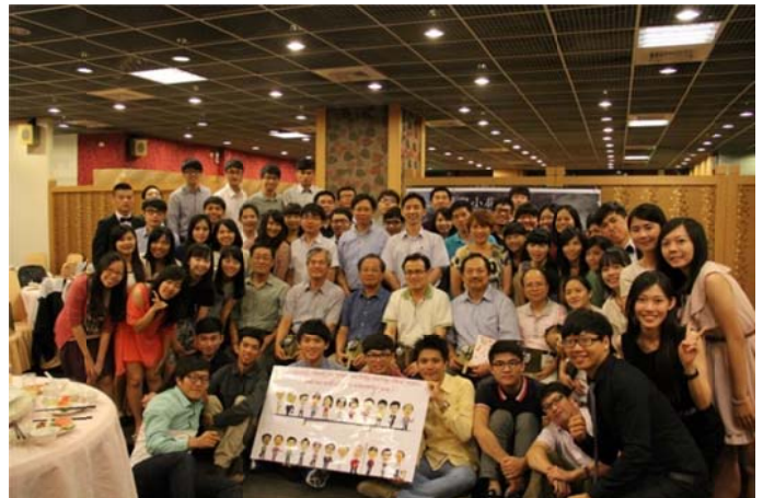
* 103 級碩士班謝師宴大合照