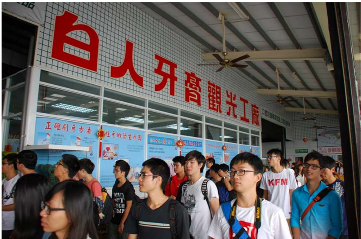
*工廠參觀-白人牙膏觀光工廠