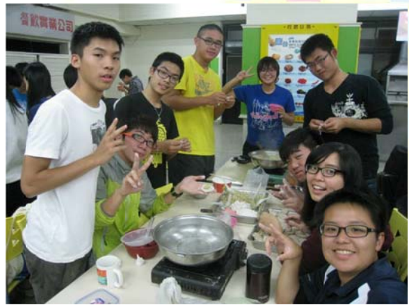
*湯餃會-餃逐中圓~餓鬥篇之決戰光餐