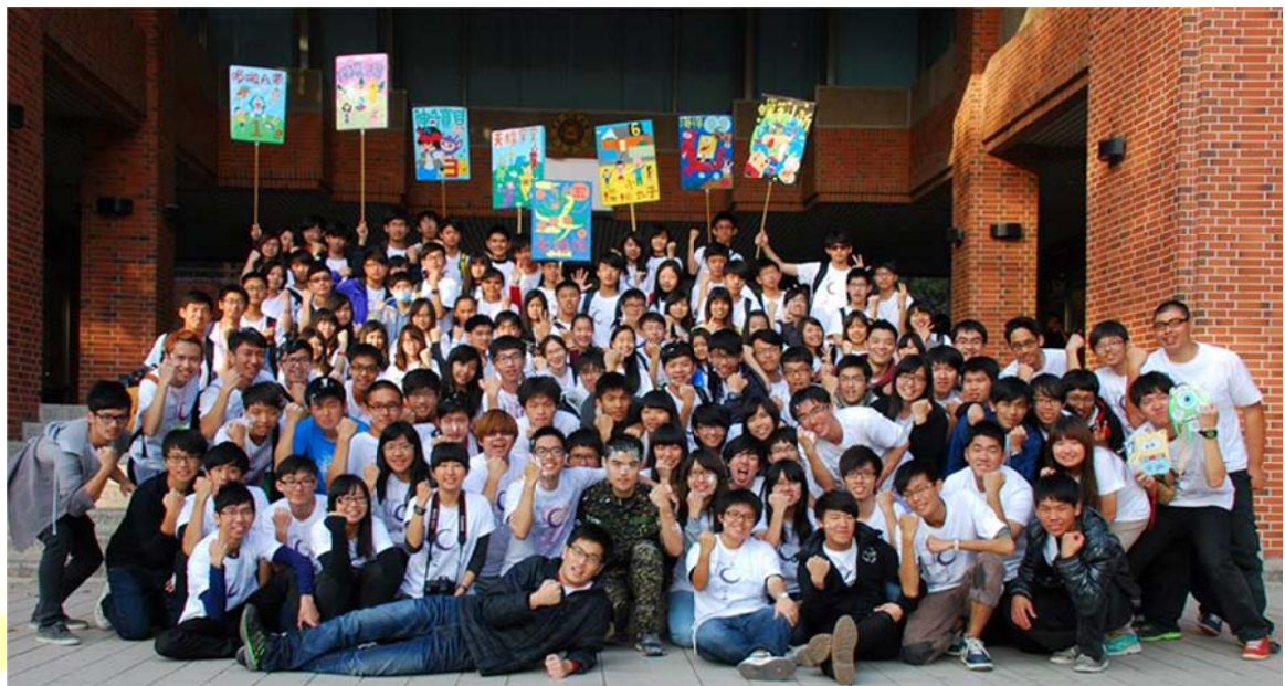
*第 16 屆成大資管營